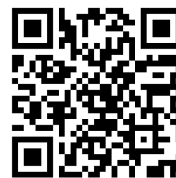
申し込みフォーム