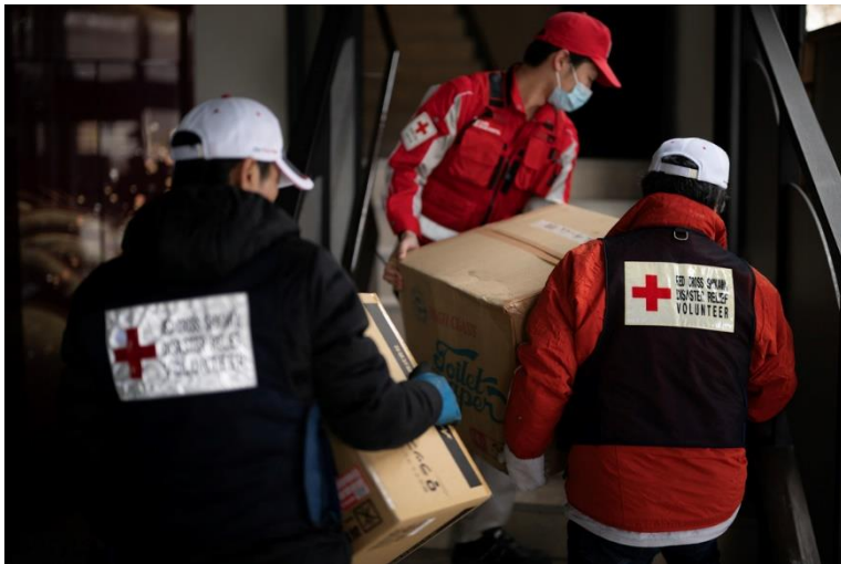
物資を運搬する赤十字ボランティアと大阪府支部救護班 （大阪赤十字病院）<石川県輪島市>