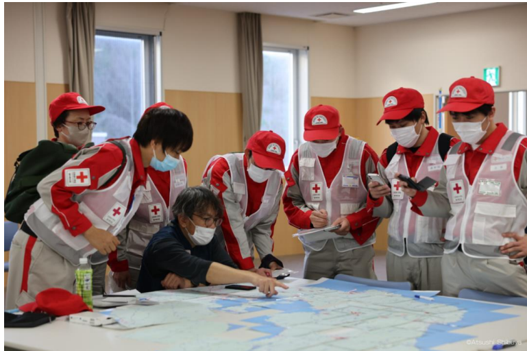
DMAT活動拠点本部スタッフからルートの説明を受ける 福井県支部救護班<石川県七尾市>