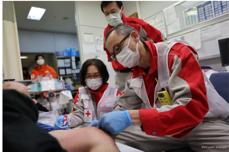
早朝の救急外来で太腿の傷を縫合する長野赤十字病院 の医師<石川県珠洲市>