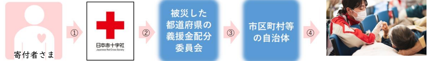
能登半島地震で被災された方へ