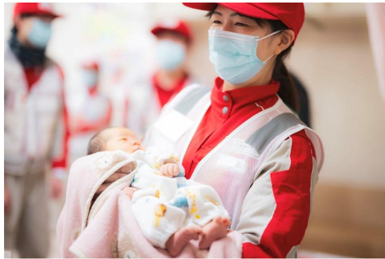
避難所で赤ちゃんを抱っこする岡山県支部救護班（岡山 赤十字病院）<石川県輪島市>