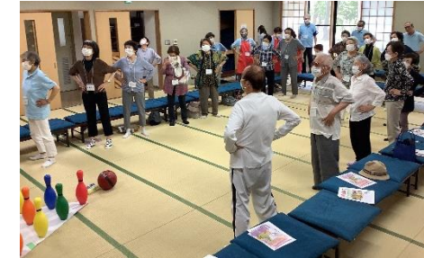
公共施設で対象者が集い体操

茶話会・会食会に体操等を取り入れ、生きがい・社会参加促進、介護予防につなげる地域の集いの場「いきいきサロン」