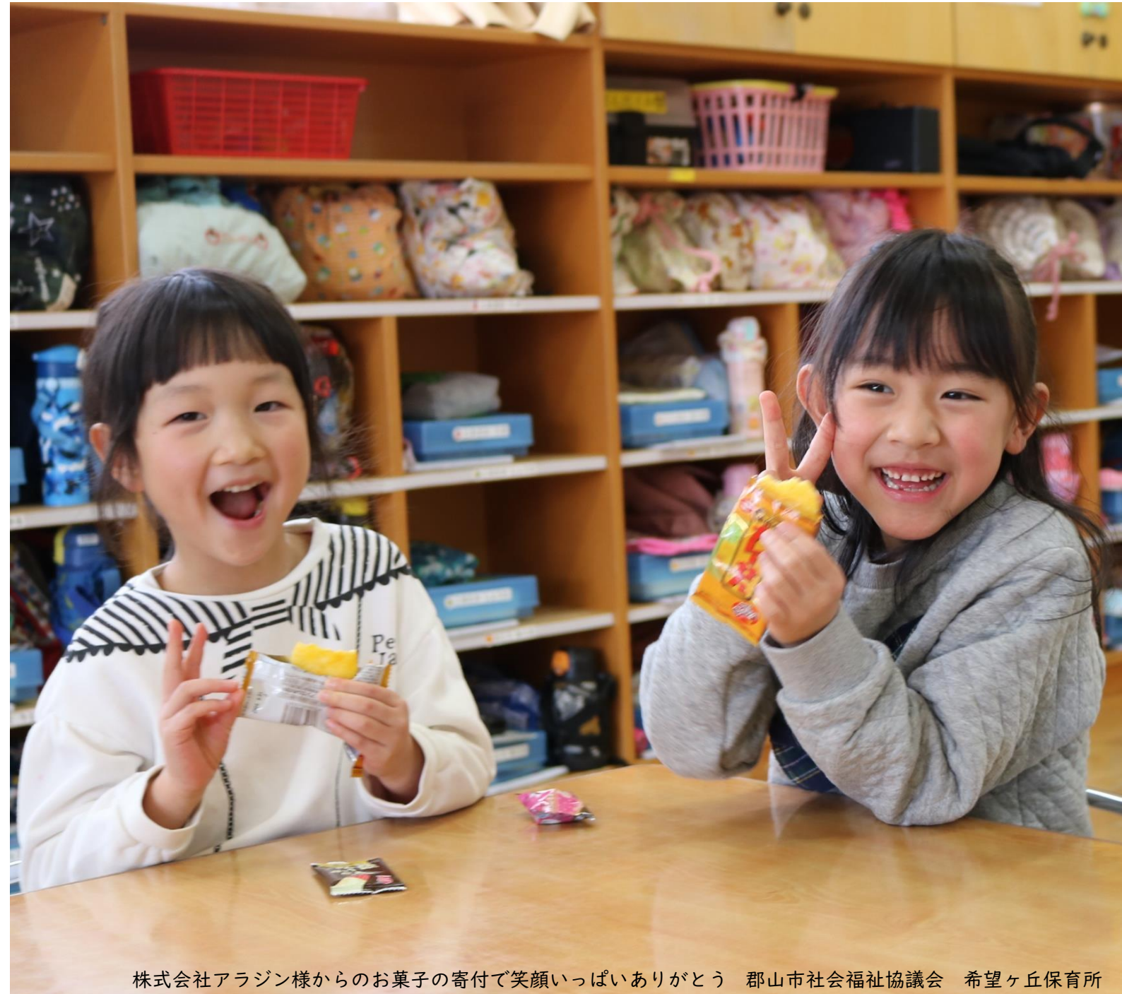
株式会社アラジン様からのお菓子の寄付で笑顔いっぱいありがとう 郡山市社会福祉協議会 希望ヶ丘保育所

特集1 郡山市社会福祉協議会の「会員会費」や「寄付金」はどのように「役立てられているか」を詳しく紹介！