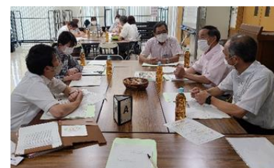
地域住民と福祉関係機関、企業等で地域の課題についての話し合い