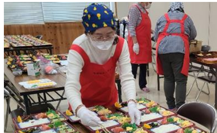
配食のお弁当を準備する福祉委員

高齢者の安否確認や心のふれあいを目的に調理した食事を対象の高齢者宅を訪問する「配食サービス」の実施