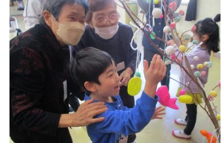
地域の高齢者と子どもでだんごさし