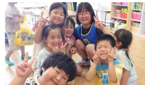
市内保育施設でボランティア体験

ゴミ出しや室内の掃除など「ちょっとした日常のお手伝いをする有償ボランティア「たすけあい活動」