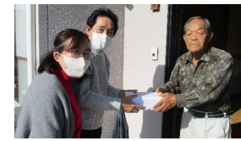
対象者のご自宅を訪問し箱ティッシュを配付

福祉委員などが対象者の自宅を訪問し、生活物品を見舞品として配付し安否確認を行う「友愛訪問」