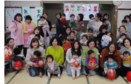
親子で小正月の飾りづくり体験

当協議会は郡山市民の皆様や法人の皆様からご協力をいただいている社協会費等で地域福祉活動を推進しています。今回は、当協議会の地域福祉推進事業を詳しくご紹介します。