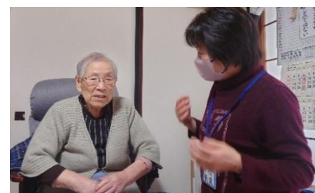
担い手と楽しく話す一人暮らしの利用者

ゴミ出しや室内の掃除など「ちょっとした日常のお手伝いをする有償ボランティア「たすけあい活動」