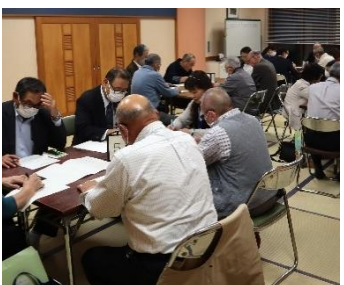
研修会に参加し、知見や認識を広めます。