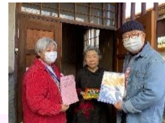
郡山地区社協赤木支部(見回り事業)