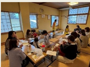
子育てサロンなどにも協力している民生委員さんがいます。

他にもいろいろ取り組みをしています 行政への協力や、地域で行われるサロンや訪問活動の福祉活動への協力も行っており、地域の中では欠かせない存在です。