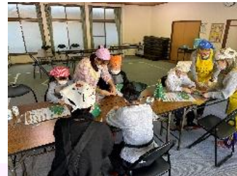
しんちゃんふぁーむ(クリスマス会)