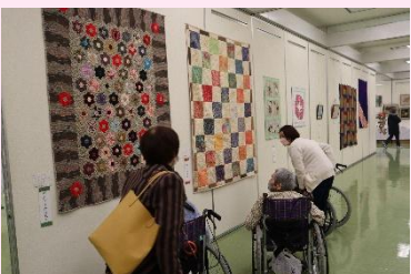
素晴らしい作品にくぎ付けの様子