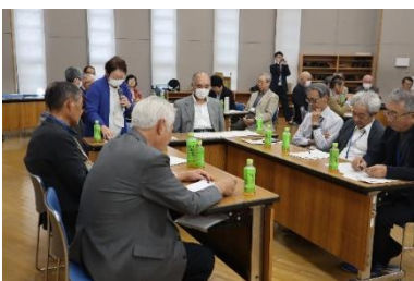
他県との視察研修会

お住まいの地域の民生委員・児童委員に関するお問い合わせはこちら↑ 市保健福祉総務課 ☎024-924-3822