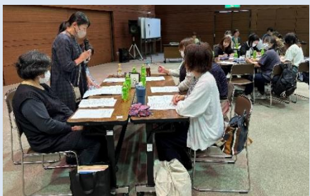
研修会の企画・運営も行います。

児童福祉活動部会は、子育て家庭の支援や、児童虐待や犯罪被害等から守り、主任児童委員の活動に必要な情報の収集などを行っています。過去の実施例としては、ファミリーホームについて