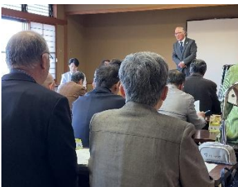
毎月、集まり情報共有を行います。

民生委員・児童委員は単なる相談窓口ではなく、地域社会を重要な役割を果たしています。行政と住民の中間に立ち、情報を的確に伝えたり、制度の「隙間」を埋めたりする役割は、制度が複雑化する現代においてますます重要となっています。 また、地域住民との継続的な関係を築くことで、課題の早期発見・早期対応につなげることが出来ます。見守り活動を通じて安心感を生み出し、孤立や虐待、貧困の連鎖を防ぐ効果も期待されます。 特に、妊娠婦への支援、子育てや障がい児支援の分野では、行政だけではカバーしきれないきめ細やかな支援が必要とされており、地域の中で顔が見える関係性をもつ民生委員・児童委員の存在は社会的にも非常に重要なものです。