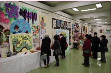
市内から出展された多くの作品