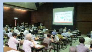
令和7年度の第1回 セミナーの様子